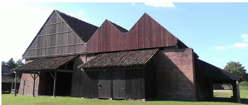
DE GERESTAUREERDE KLAMPOVENS OP DE SITE FRATEUR.